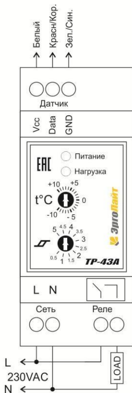
Схема 1. Подключение терморегулятора и нагрузки к общей сети питания

Для снижения энергопотребления допускается каскадное включение двух терморегуляторов. TP-41В измеряет уличную температуру и подает питание на другой терморегулятор (с литерой А на конце, например TP-43A) только при определенном диапазоне температуры воздуха. А второй терморегулятор (с литерой А на конце) поддерживает заданную температуру обогреваемого объекта.