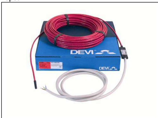
Рис. 1. Нагревательный кабель Deviflex™ DTIP-18.

Нагревательный кабель Deviflex™ DTIP-18 (рис. 1) применяется для внутренней или наружной установки и используется во множестве различных областей (таблица 1). Он предназначен для подогрева бетонных полов при устройстве комфортного – систем “Тёплый пол”, или полного отопления помещения, систем аккумуляции тепла с использованием ночного тарифа, а также для защиты от снега и льда открытых площадок, подогрева грунта, защиты трубопроводов от замерзания.