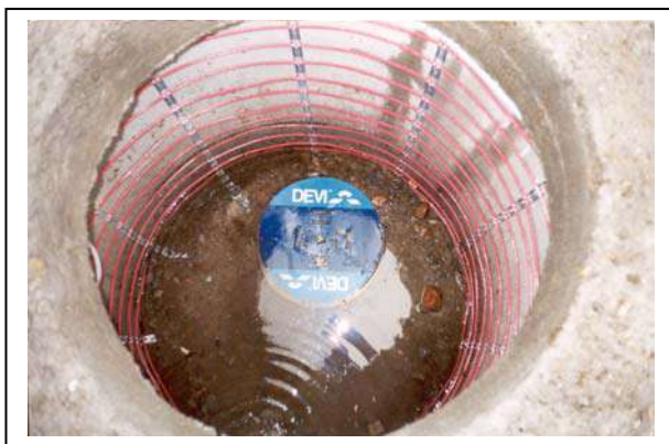
Рис. 4. Монтаж нагревательного кабеля Deviflex™ DTIP-18 в дренажном колодце.

1 – соединительная муфта; 2 – нагревательный кабель; 3 – монтажная лента Devifast™ ; 4 – датчик температуры пола в гофрированной трубке; 5 – монтажная коробка.