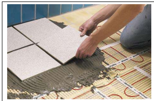
Рис. 3. Монтаж нагревательного мата Devimat™ DTIF в ванной комнате на старую плитку.