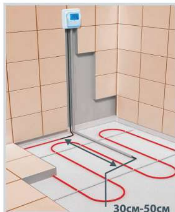
Схема укладки датчика температуры в гофрированной трубке