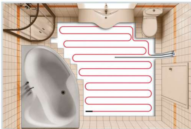
Схема укладки кабеля на свободную площадь